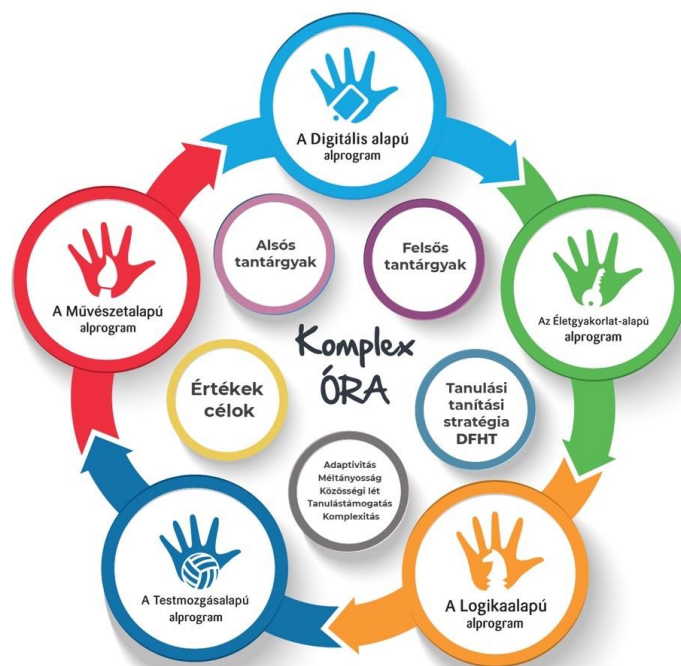
A Komplex órák felépítése